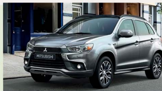
Mitsubishi Asx 2.0 Invite sda 2wd Bi-fuel (Gpl)