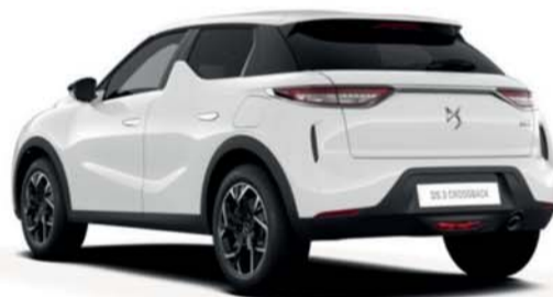
Ds3 Crossback Blue HDI 110 Performance Line