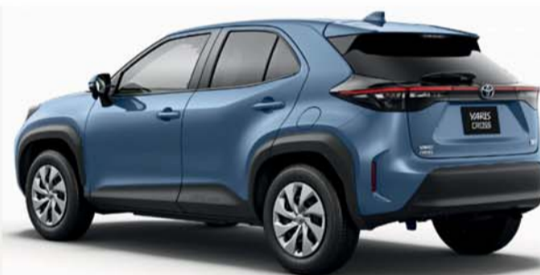
Toyota Yaris Cross 1.5H 116cv E-Cvt Active