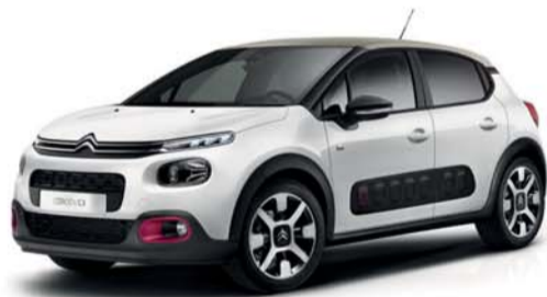
Citroen C3 Pure Tech 83 S&S Feel