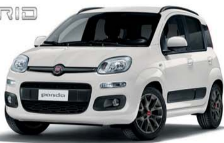
Panda Hybrid 1.0 70 cv Pay x drive

In dotazione monopattino elettrico più € 50,00 di buono benzina