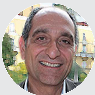
di GIUSEPPE CAMPANILE Università di Napoli

Il futuro dell'allevamento animale dovrà, pertanto, necessariamente assicurare la sostenibilità ambientale, il benessere animale e la qualità dei prodotti intesa nel migliorare l'apporto di molecole funzionali. Tutto ciò dovrà essere correttamente veicolato al consumatore. Lo sviluppo futuro delle produzioni animali e vegetali, infatti, non potrà prescindere dal ricorso delle scienze ingegneristiche e da altre soluzioni tecnologiche utili a migliorare l'efficienza di produzione di prodotti alimentari. L'ingegneria e altre soluzioni tecnologiche avranno anche un ruolo importante nell'integrazione