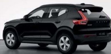
Volvo Xc40 Suv T4 Plug-in Hybrid auto Rech Inscript Expr