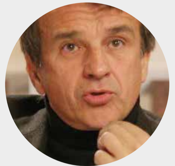
Raffaele Morelli, Psichiatra

4 Ne parla come di un fenomeno essenzialmente “culturale”.