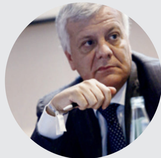
Gian Luca Galletti, Ministro dell'Ambiente

“A settembre l'Italia sarà impegnata nella Conferenza delle Parti CITES che si terrà in Sudafrica, in cui sarà proposta l'inclusione di diverse nuove specie nelle Appendici della Convenzione. Mi piace ricordare, poi, l'“Ivory Crush” che si è svolto a fine marzo al circo Massimo di Roma e ha visto la distruzione, simbolica ma con un messaggio chiaro, di mezza tonnellata di avorio sequestrato. Un evento con il quale l'Italia ha rafforzato ancora di più l'impegno nella protezione degli elefanti africani contro il bracconaggio, nell'ambito dell'azione europea di contrasto a queste pratiche criminali. Obiettivo del mio ministero è vietare anche il commercio legale di avorio, in Italia e in Europa. Ogni quarto d'ora, infatti, muore un elefante e la specie quindi si estinguerà tra pochi anni: io credo sia un dovere morale dell'Europa, che commercializza un terzo dell'avorio a livello mondiale, prendere una posizione forte contro il massacro di queste specie”.