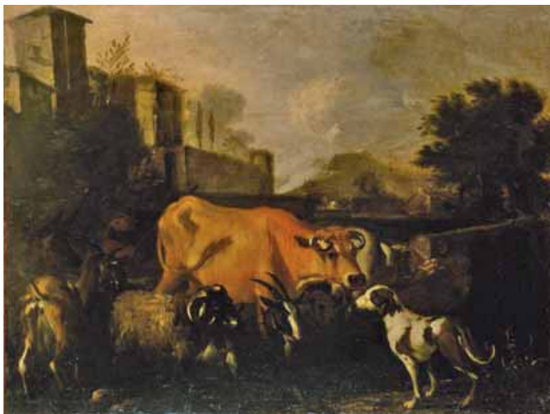
PAESAGGIO CON ANIMALI, PINACOTECA DI PALAZZO CHIERICATI, VICENZA

allarmi rilanciati dai mezzi di comunicazione di massa che periodicamente diffondono notizie come: "Aviaria, viaggio nel paese dell'epidemia dove si sterminano 50mila galline al giorno", "Non si attenua l'aviaria in Emilia: terzo caso di contagio umano", che sottolineano come alcune malattie infettive del bestiame a volte siano anche delle pericolose